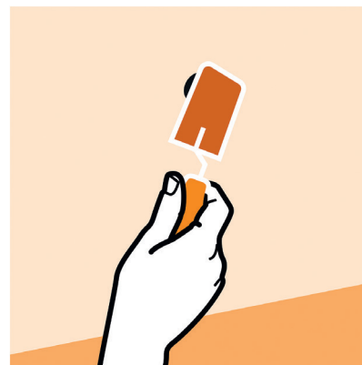
Étape 3 : régler